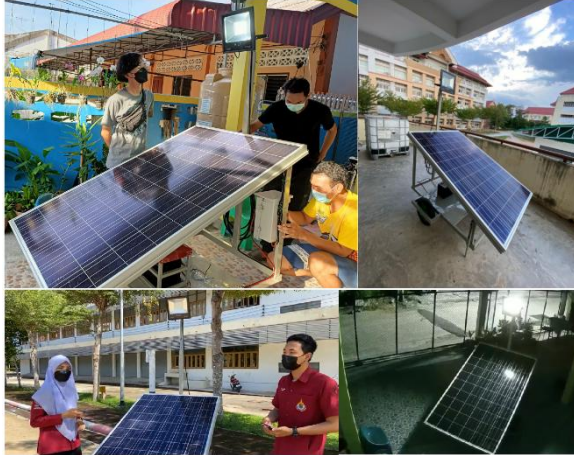
Figure 2 การติดตั้งและทดสอบโคมฉายแบบเคลื่อนที่ พลังงานแสงอาทิตย์

ประสิทธิภาพและระยะเวลาการทำงาน ซึ่งทำการเก็บข้อมูลการทำงานทั้งก่อนและหลังเปิดใช้งาน โดยทำการเก็บข้อมูลเป็นระยะเวลา 7 วัน เช่นเดียวกัน ดัง Table 3